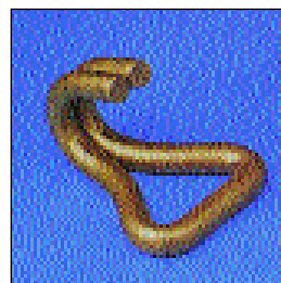
Gancio doppio uncino