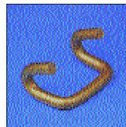
Gancio ad "U"