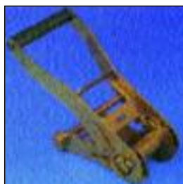
Tendinastro 5.000 kg